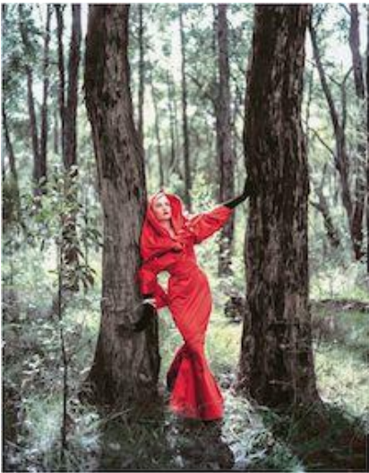
9. Helmut Newton Moda, ca. 1960's Fashion ca. 1960's