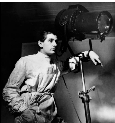
6. Helmut Newton Autoritratto nello studio di Yva. Berlino, 1936 Self-portrait at Yva's studio. Berlin, 1936