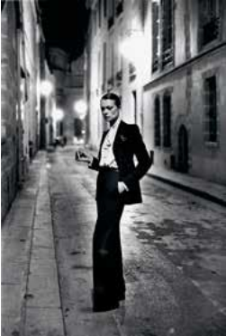
4. Helmut Newton Rue Aubriot, Yves Saint Laurent, Vogue Francia. Parigi, 1975 Rue Aubriot, Yves Saint Laurent, French Vogue. Paris, 1975