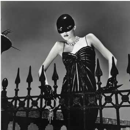
5. Helmut Newton Vogue Italia. Como, 1996 Italian Vogue. Como, 1996