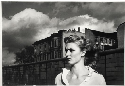
10. Helmut Newton Il muro di Berlino, Berlino 1977 Berlin Wall, Berlin 1977