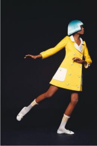
11. Helmut Newton Elle. Parigi, 1967 Elle. Paris, 1967