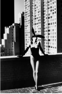
3. Helmut Newton Elsa Peretti vestita da coniglio. New York, 1975 Elsa Peretti as a Bunny. New York, 1975