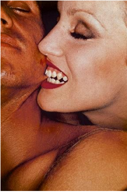
7. Helmut Newton Jerry Hall, Vogue America. Parigi, 1974 Jerry Hall, American Vogue. Paris, 1974